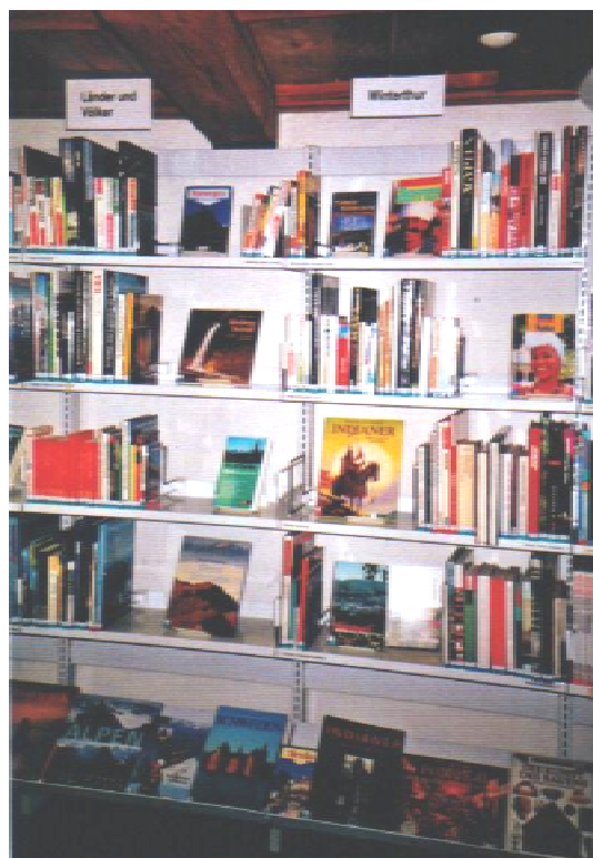
Themenbereich „Länder und Völker“ und „Winterthur“

Die Mitglieder der Arbeitsgruppe, Leiterinnen verschiedener Filialen, lieferten Ende 1998 den Schlussbericht ab. Auf dieser Grundlage wurde die Bibliothek Oberwinterthur reorganisiert und ganz nach den neuen Aufstellungsprinzipien eingerichtet. Die Eröffnung im Frühling 1999 war der Auftakt zur Diskussion des Themas "fraktale Bibliothek" in weiten Kreisen. Die Zürcher Kantonale Kommission schaltete sich ein, und die vielen Besuche aus anderen Bibliotheken in Oberwinterthur zeigen auch zwei Jahre später noch, wie gross das Interesse an diesem neuen Modell ist.