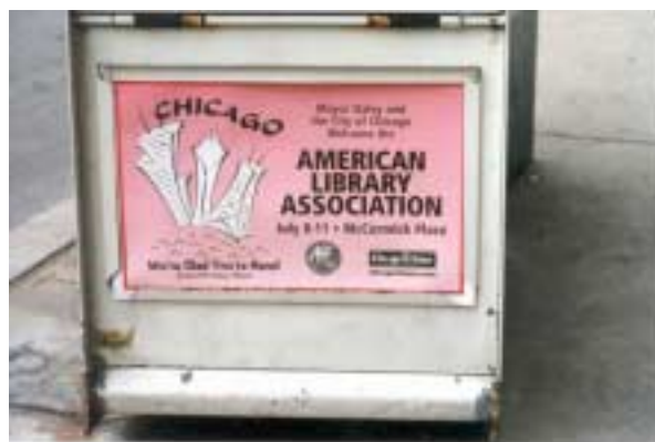
Begrüssung der Teilnehmenden am ALA-Kongress